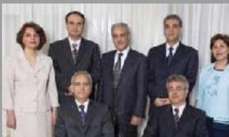
Leiders van religieuze Bahai gearresteerd