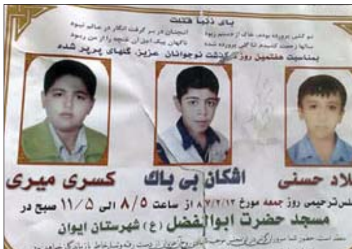
DRIE KINDEREN GEDOOD BIJ EEN MANIFESTATIE IN IVAN-E-GHARB

De mensen protesteerden tegen de willekeurige inbeslagname door de Staatsveiligheidsdienst van een transportvoertuig voor handelswaar van de plaatselijke bevolking.