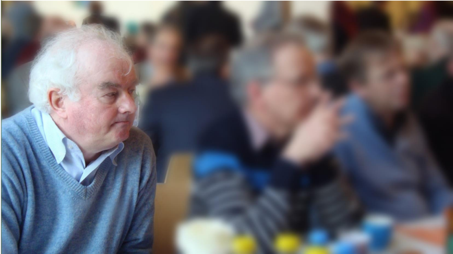
Wim, Mesdag museum - SMV Bijeenkomst - Lezing door de dochter van Desmond Tutu, Den Haag - april 2011