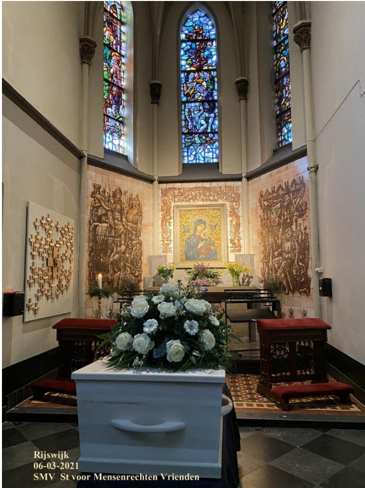
Rijswijk 06-03-2021 SMV St voor Mensenrechten Vrienden