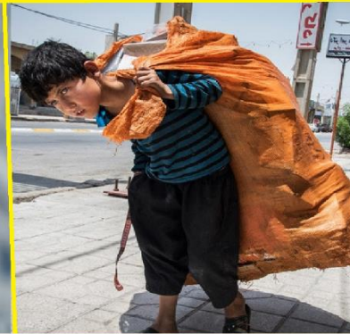
Helft van de kinderen van Afghaanse migranten