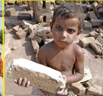
Komen uit gezinnen met ziekte, armoede