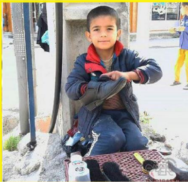
Vaak gebruikt als afvalsorteerders