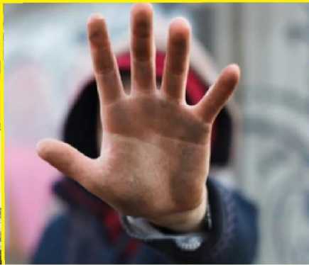
Meestal in stadscentra 200.000