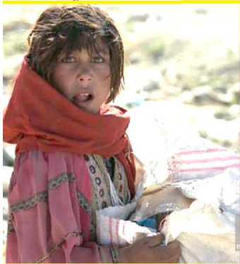
Geschat op 200.000